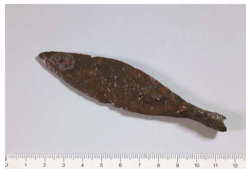
Figura 4. Punta di freccia a foglia di alloro (dal Portale IPAC Regione Friuli Venezia Giulia, Scheda RA_1456).