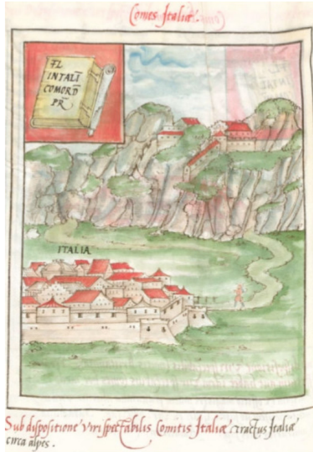
Figura 1. La rappresentazione del comes Italiae nella Notitia Dignitatum (da Kos 2014).

L'area interessata dall'ipotetico castrum Nemas ricade nella fascia collinare compresa tra il torrente Cornappo e il rio Montana che scorre a est dell'abitato di Nimis. I rilievi che configurano questo settore presentano altimetrie tra i 368 m. s.l.m. del monte Machefave a sud e i 470 m. s.l.m. del monte Zuccon in cui sono stati individuati i resti archeologici più consistenti.