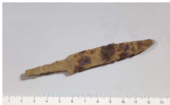
Figura 3. Coltello altomedievale (dal Portale IPAC Regione Friuli Venezia Giulia, Scheda RA_1459).

frammentari e datati tra V-VI secolo d.C. e il periodo tardorinascimentale, con un possibile calo di presenza attorno all'anno Mille. Tra V e IX secolo d.C. si collocano i contenitori in ceramica comune, mentre al V-VIII sec. d.C. possono essere datati alcuni coltelli in ferro, tra i quali un esemplare con codolo ripiegato a occhiello simile al tipo «Farra» (fig. 3) e una punta di freccia (fig. 4). I secoli XIV-XVII d.C. hanno restituito relativamente pochi reperti archeologici: frammenti di ciotole invetriate, brocche e ceramica graffita (fig. 5), una moneta veneziana, fibbie da cintura e da calzari, piccoli oggetti d'uso quotidiano. Dalla distribuzione omogenea dei manufatti non è stato possibile ipotizzare una dinamica dell'insediamento nel corso dei secoli. Sembrerebbe che quest'area abbia vissuto un'intensa occupazione sin dalle origini del castrum e per tutto il Medioevo (Cipollone 2006).