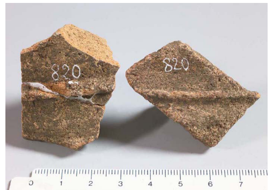
Figura 7. Pareti di anfora del tipo Late Roman 2 (dal Portale IPAC Regione Friuli Venezia Giulia, Scheda RA_1470).