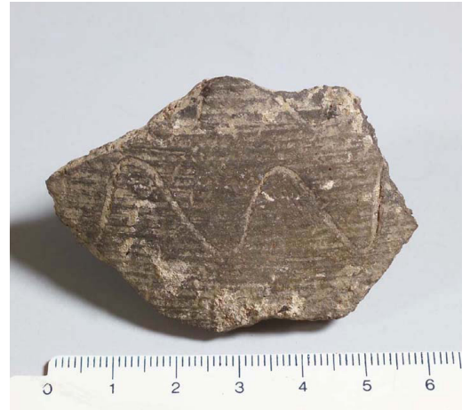
Figura 6. Pareti di anfora del tipo Late Roman 1 (dal Portale IPAC Regione Friuli Venezia Giulia, Scheda RA_1471).

L'identificazione con l'altura su cui sorge San Giorgio è logica? Cercherò di rispondere. Sicuramente nel territorio di Nemas un castrum doveva esistere, se si fa affidamento alla citazione di Paolo Diacono, ma la sua posizione ancora ci sfugge. La situazione suggerisce che la sua identificazione non sia da porre in relazione a qualche edificio storico o a ritrovamenti