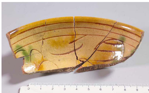
Figura 5. Ciotola rinascimentale a pareti emisferiche in ceramica ingobbata graffita e dipinta in giallo ferraccia e verde ramina, sotto vetrina. (dal Portale IPAC Regione Friuli Venezia Giulia, Scheda RA_1465).

Le più antiche evidenze archeologiche erano pertinenti a un edificio di natura abitativa o artigianale costruito sul banco di flysch affiorante da datare tra V e VII secolo d.C. (Cipollone 2006). A est, esso era delimitato da una struttura in pietrame con orientamento nord-sud che attraversava buona parte della navata e che aveva il limite meridionale coincidente con quello della chiesa.