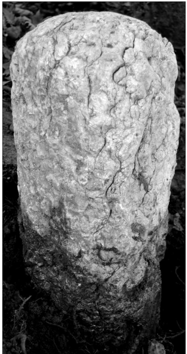
Fig. 3. Reciago di Lonato (Brescia). Miliario “muto” ancora in situ .

tenzione della strada su cui il miliario era collocato 12 , ovvero la grande arteria che univa Mediolanum con Aquileia , e che costituiva un asse viario di fondamentale importanza strategica nelle comunicazioni fra Occidente e Oriente 13 .